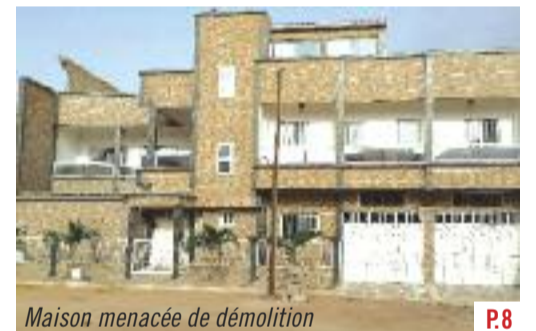
Maison menacée de démolition

"Entre les mains du Bon Dieu et de Macky"