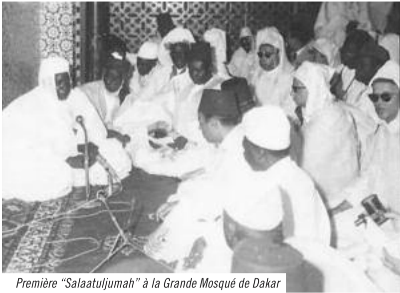
Première “Salaatujumah” à la Grande Mosquée de Dakar