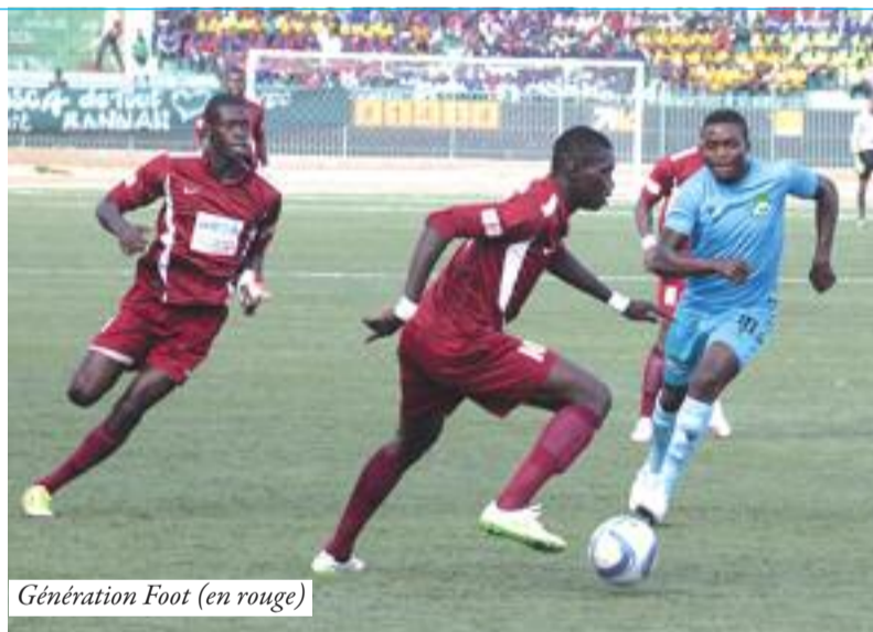
Génération Foot (en rouge)