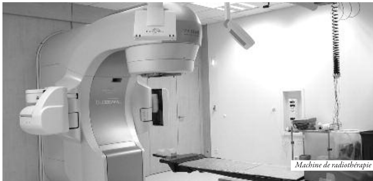
Machine de radiothérapie

Depuis leur arrivée au Sénégal, la population ne cesse de se demander à quand le démarrage des deux machines de radiothérapie. Mais pour les spécialistes, l'heure n'est pas à la précipitation, mais au travail bien accompli. En plus il urge de mener des réflexions sur le coût de séance de ces nouveaux appareils.