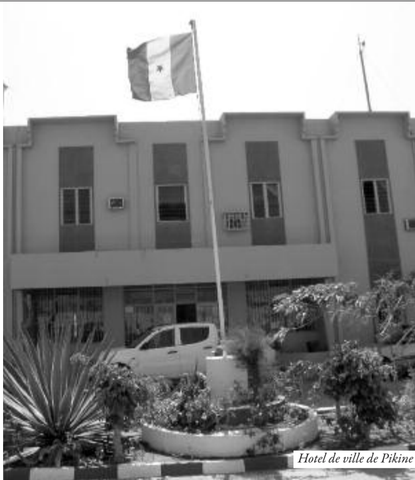
Hotel de ville de Pikine

6 080 voix, Yaw 5 778, la Grande coalition Wallu Sénégal 1 650 voix et Gueum Sa Bopp 1 089 voix. Il y avait 49 314 électeurs et 20 175 ont voté. "La réalité est que cette commune a fait confiance à BBY. Nous avons une différence de 322 voix entre BBY et Yaw. Il s'agit d'une victoire nette et sans bavure. Ceci prouve que les populations ont encore confiance en nous. Maintenant, nous n'avons pas le temps pour des enfantillages. Nous appelons nos adversaires à reconnaître leur défaite, comme nous l'avons fait dans les communes où nous avons perdu. Cela ne sert à rien de crier, car en 2022, personne ne peut voler des élections. C'est impossible. Qu'ils soient des gentlemen et sachent raison garder. Nous avons fait tous les coins de cette commune. Nous avons présenté à la population un bilan et un programme, et elle a apprécié. Je pense qu'il n'y a plus de débat. C'est une victoire confortable qui nous permet de dérouler notre programme pour les prochaines années. Nous avons 50 conseillers