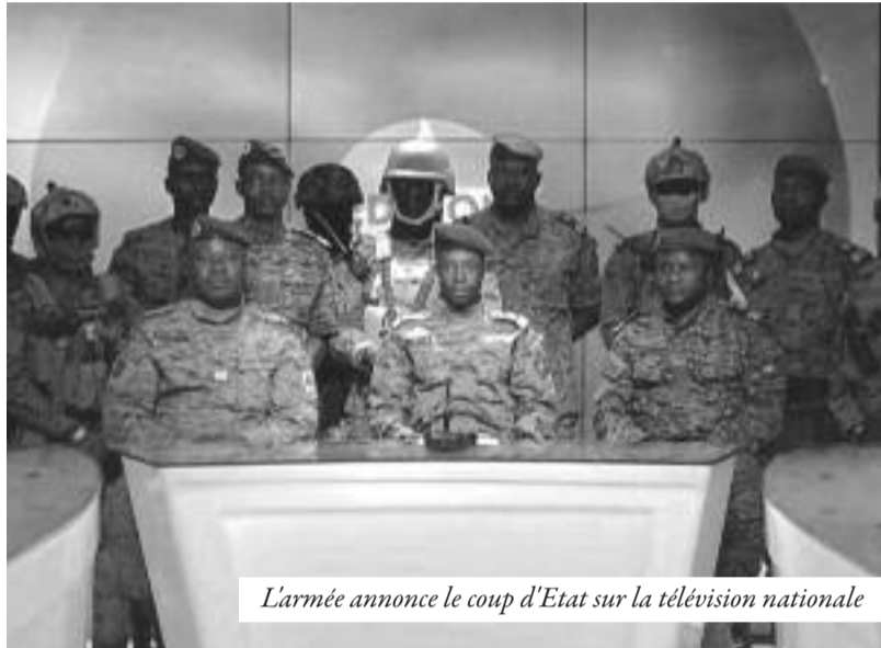
L'armée annonce le coup d'Etat sur la télévision nationale

La situation sécuritaire inextricable dans laquelle s'est embourbé le Burkina Faso, a fini par emporter le président Roch Marc Christian Kaboré. Hier, des militaires ont annoncé la prise du pouvoir, la suspension de la Constitution et la fermeture des frontières du pays.