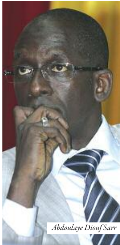
Abdoulaye Diouf Sarr

Le raz de marée de la coalition Yewwi Askan Wi dans la région de Dakar et d'autres localités du pays, n'aura pas épargné une dizaine de ministres qui ont vu leur volonté de consolider leur assise politique s'évaporer le temps d'un long dimanche électoral. Ainsi, Abdoulaye Diouf Sarr (Santé), Amadou Hott (Économie), Assome Diatta (Commerce), Yankhoba Diattara (Télécommunications) et Oumar Guèye (Collectivités territoriales) ont tous subi la dynamique de Yewwi Askan Wi. Des défaites qui pèseront lourd dans la nouvelle reconfiguration de la prochaine équipe gouvernementale qui doit être mise en place dans les prochaines semaines.