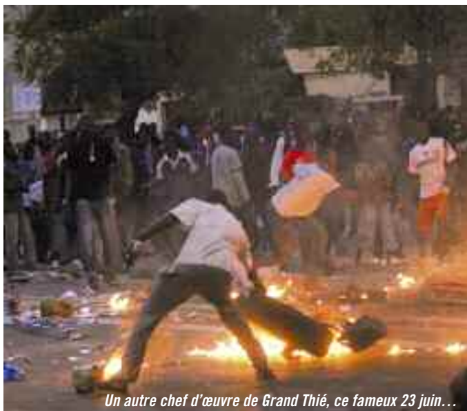
Un autre chef d'œuvre de Grand Thié, ce fameux 23 juin...